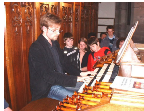
Sortie pédagogique en Alsace