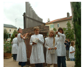
L'hydraule à la fête de la mirabelle