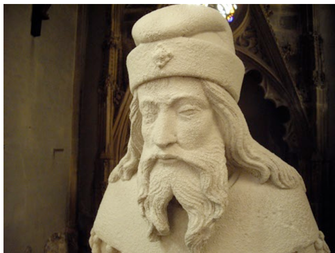
Statue en restauration recouverte de pulpe de papier